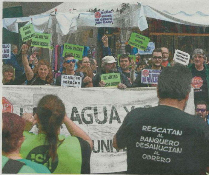
Una protesta ciudadana contra los desahucios y los abusos bancarios.

Los magistrados de la Sección Sexta recuerdan la obligación de comunicar al cliente la cantidad que se adeuda, pero en este caso «la que se ha comunicado es sustancialmente errónea» debido a «la aplicación durante la vida del contrato de una cláusula nula». Por ello, concluyen que la ejecución hipotecaria -el procedimiento judicial que inician las en-